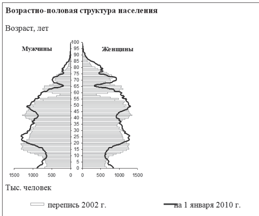
Рис.3. Возрастно-половая пирамида населения России.

численностью, соответственно, неизбежно новое падение рождаемости.